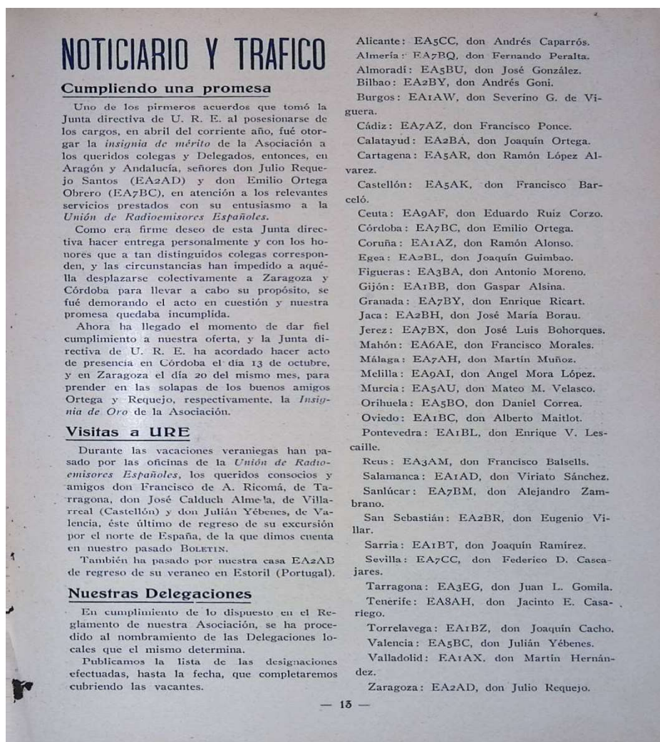
Página 13 de la revista de octubre de 1935 de la Unión de Radioemisores Españoles, donde se muestra la relación de Delegación de la URE en la pre guerra.