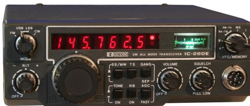
Imagen de un ICOM IC-260E propiedad de la familia Monzonís-Casaña en los años 80.

El equipo que usaba Silvia para realizar sus comunicados en VHF era uno de los equipos que tenía la familia. Su preferido era el ICOM IC-260E como el de la imagen.