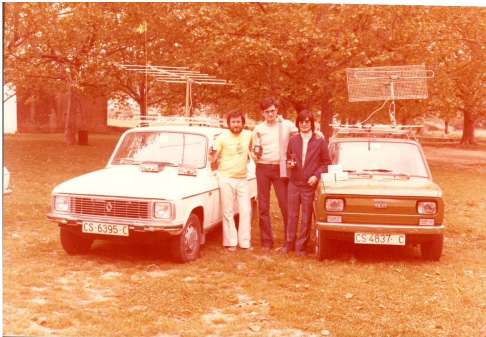
Foto de finales de los años 70, principios de los 80

Imágenes del Paseo Ribalta en Castellón, con todos los coches preparados para iniciar una cacería del zorro.