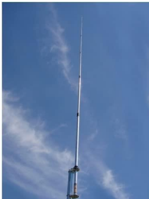
Imagen de una antena de \frac{1}{2} onda para la banda de 27mhz con carga en la base, similar a la instalada por Santiago Franch EC5BKH

El aspecto de la antena que se instaló en su domicilio era similar al siguiente: