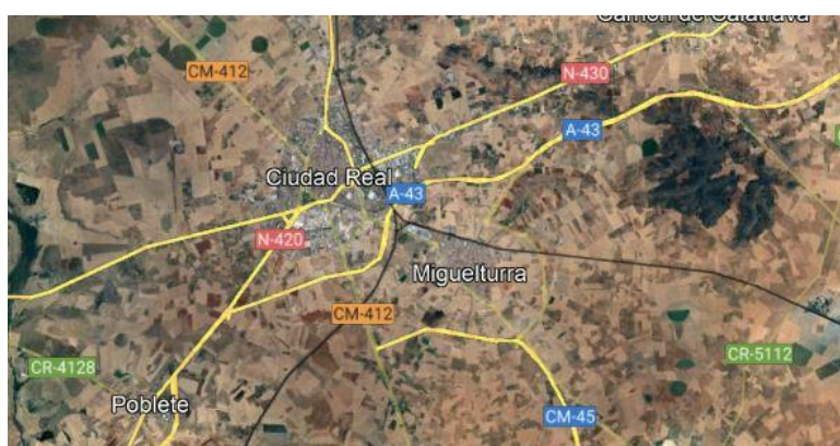
Situación en mapa de Ciudad Real capital.

Eran tiempos en los que todavía no existían los walkies PMR para los que no se necesita licencia de radioaficionado y podían hacer el mismo servicio de intercomunicador. Tampoco estaba muy implantada la red de telefonía móvil.