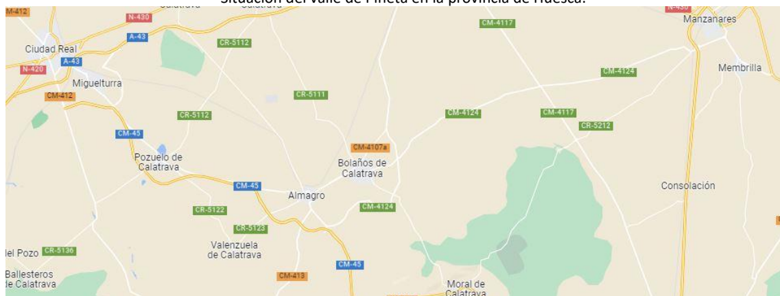
Situación en el mapa de Almagro (CR).