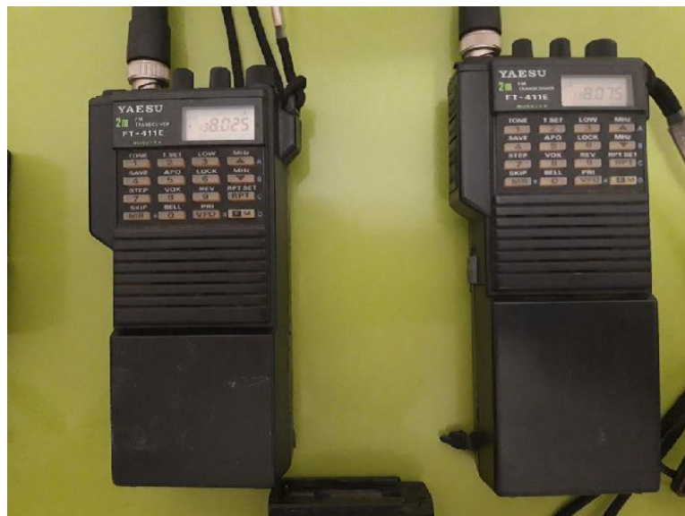
Imagen de una pareja de walkies talkies Yaesu FT-411 similares a los que utilizaba Merche EB5JDB

Así lo hizo declarando como emisora móvil un walkie talkie de la marca Yaesu puntero en aquellos años, el FT-411