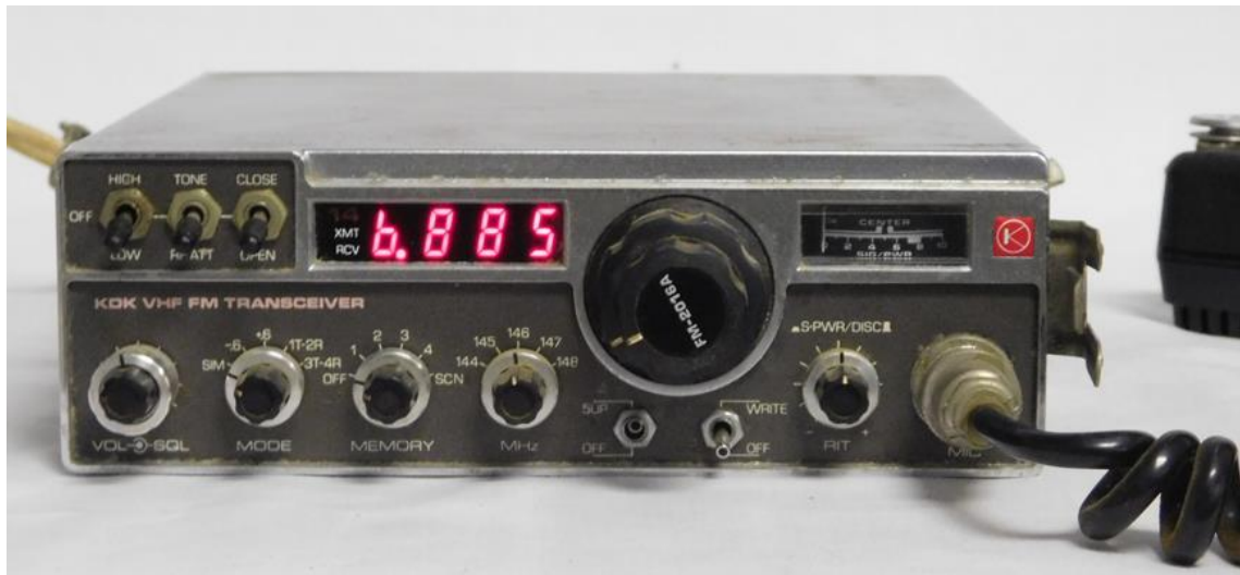
Equipo de VHF KDK similar al que tuvo Polo EB5CUJ en los años 80 y 90.