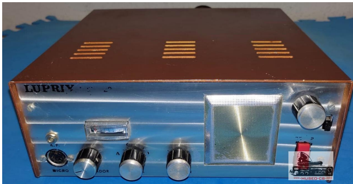
Frontal de un equipo Luprix de 27mhz de los años 60 acorde a la descripción dada por Antonio Font.