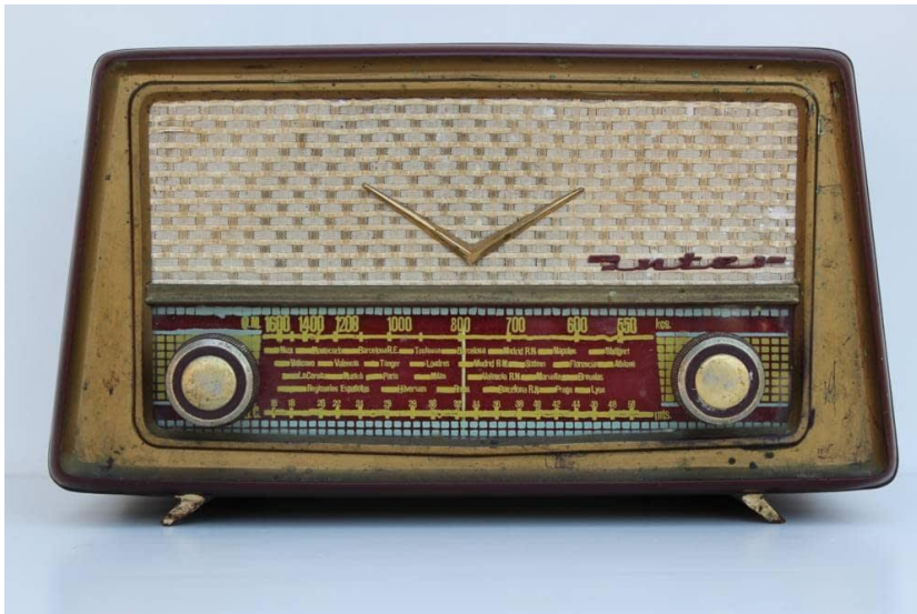
Ejemplo de una radio a lámparas de época, con receptor en AM en la OM y OC

En aquellos años, era típico que los novicios utilizaran como receptor una radio musiquero, es decir, una radio a lámparas de las que había en todas las casas de este tipo: